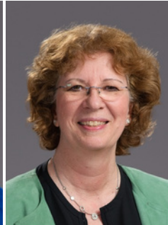
Bettina Szelag Bürgermeisterin