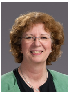
Bettina Szelag Bürgermeisterin